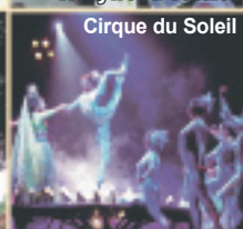
Cirque du Soleil