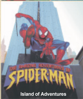
Island of Adventures