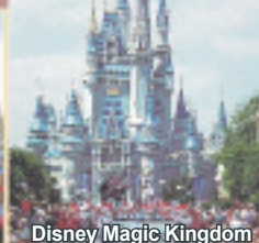
Disney Magic Kingdom